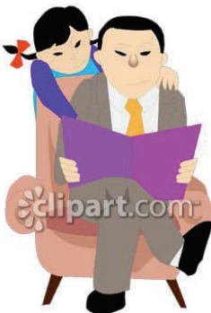
8. El padre y la hija